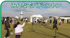
みんなでバドミントン