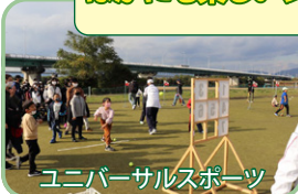
ユニバーサルスポーツ